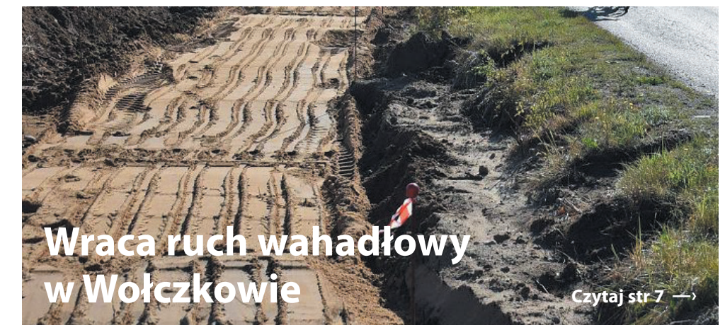
Wraca ruch wahadłowy w Wołczkowie