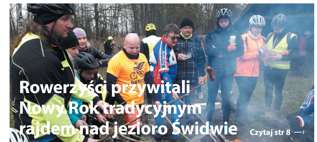
Rowerzyści przywitali Nowy Rok tradycyjnym rajdem nad jezioro Świdwie