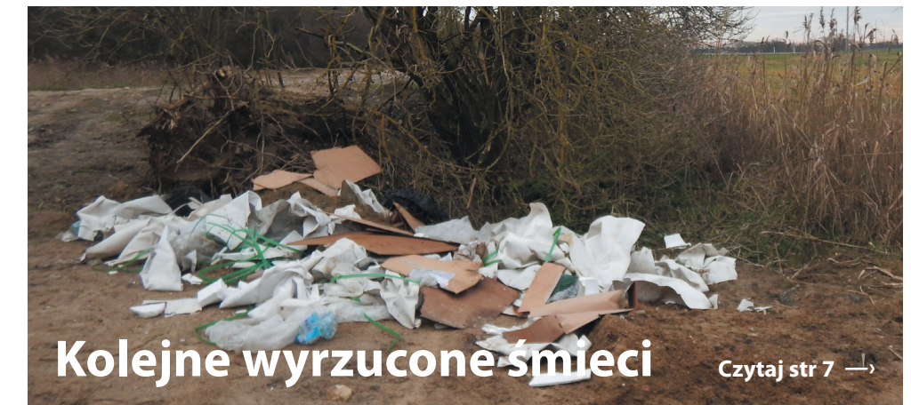
Kolejne wyrzucone śmieci