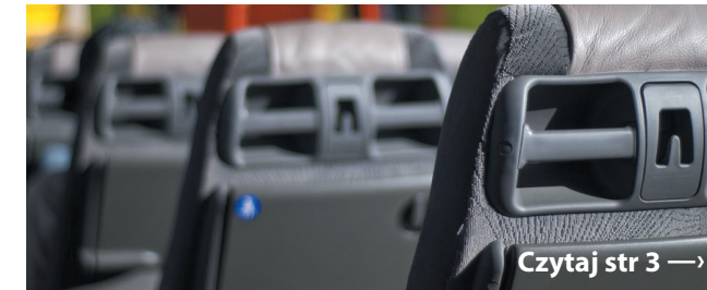
Trwają prace nad rozwiązaniem problemu z transportem lokalnym w Nowym Warpnie