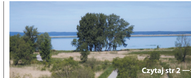
Powstaje rowerowa pętla wokół Zalewu Szczecińskiego