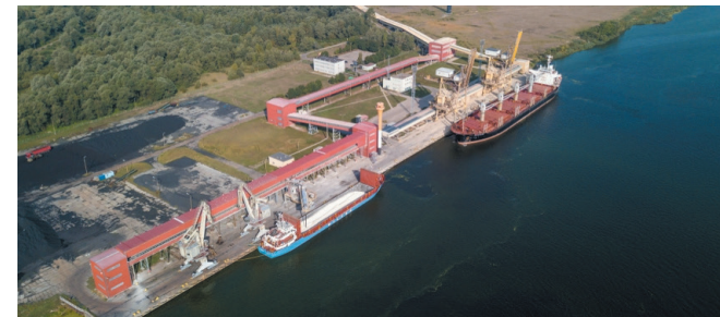
powiania na wyłonienie wykonawcy kompleksowej dokumentacji projektowo - kosztorysowej w zakresie, za który odpowiada ZMPP Sp. z o.o.

Zarząd Morskiego Portu Police Sp. z o.o. realizuje obecnie prace przedprojektowe w ramach koncepcji programowo - lokalizacyjnej budowy stacji kolejowej "Police Port" wraz z niezbędną infrastrukturą techniczną w ramach budowy linii kolejowej nr 437 do Portu Morskiego Police wraz z opracowaniem wytycznych do SIWZ na przeprowadzenie postę-