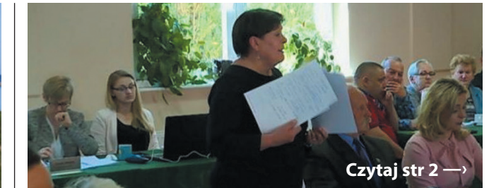
Referendum w Dobrej

BEZRZECZE | BUK | DOBRA | DOŁUJE | ŁĘGI | MIERZYN | RZĘDZINY | SKARBIMIERZYCE | STOLEC | WĄWELNICA | WOŁCZKOWO