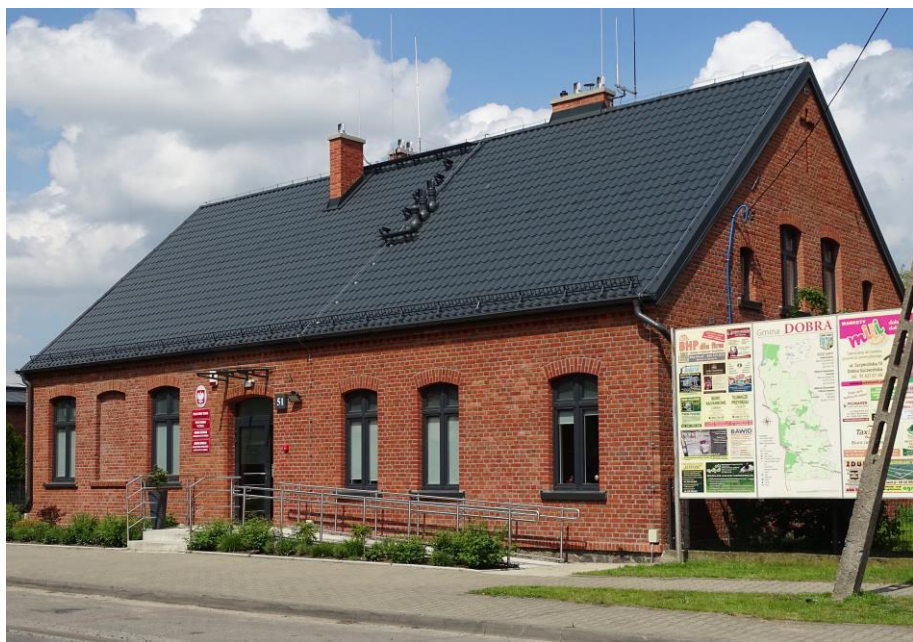
Widok ogólny od płd.-zachodu

Dawna szkoła, zaadaptowana na potrzeby biurowe urzędu gminy – po generalnym remoncie. Budynek założony na planie prostokąta, parterowy, nakryty wysokim dachem dwuspadowym naczółkowym, z mieszkalnym poddaszem. Ściany murowane z cegły ceramicznej, nietynkowane. Elewacje zachowały pierwotną kompozycję, akcentowane fakturą i kolorystyką muru ceglanego. Fasada 7-osiowa, lustrzanie symetryczna, zwieńczona gzymsem pilastym, a otwory ujęte odcinkowymi nadprożami. Stolarka okienna i drzwiowa współczesna, odwzorowująca pierwotne formy.