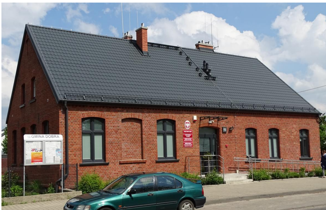
Widok ogólny od pld.-zachodu

8. Fotografia z opisem wskazującym orientację albo mapa z zaznaczonym stanowiskiem archeologicznym