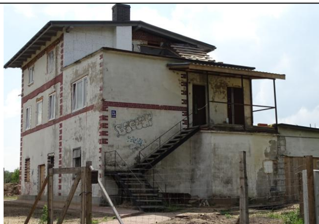
Widok ogólny od północy