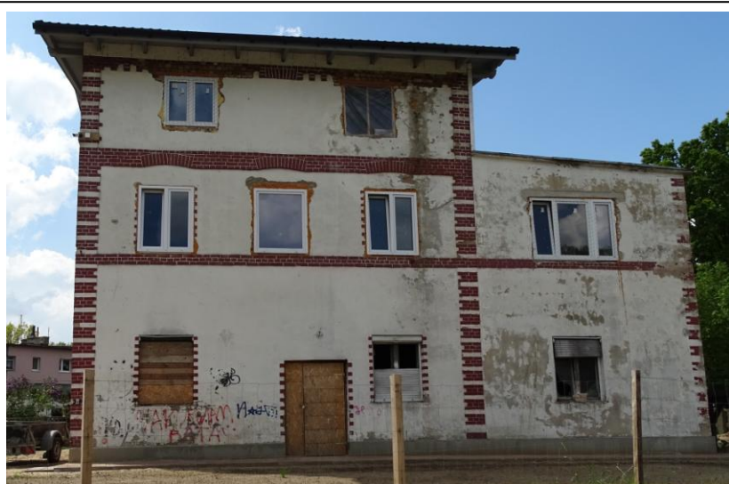
Widok ogólny od wschodu

8. Fotografia z opisem wskazującym orientację albo mapa z zaznaczonym stanowiskiem archeologicznym