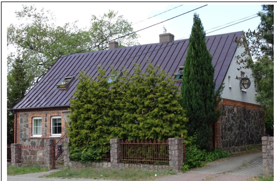
Widok ogólny od płd.-wschodu

Dom mieszkalny w typie chałupa, założony na planie prostokąta, parterowy, podpiwniczony, nakryty wysokim dachem dwuspadowym z mieszkalnym poddaszem. Ściany murowana z kamienia łamanego (na kamiennym cokole), nietynkowane; szczyty ceglane tynkowane na gładko. Elewacje o pierwotnej kompozycji i wystroju opartym na naturalnych walorach budulca. Fasada 5-osiowa, symetryczna, akcentowana ceglanym detalem: narożne lizeny, wieńczący gzyms pilasty obramienia okienne z odcinkowymi nadprożami. Stolarka współczesna, ale osadzona w pierwotnych otworach.