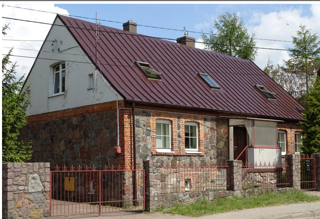
Widok ogólny od płd.-zachodu

8. Fotografia z opisem wskazującym orientację albo mapa z zaznaczonym stanowiskiem archeologicznym