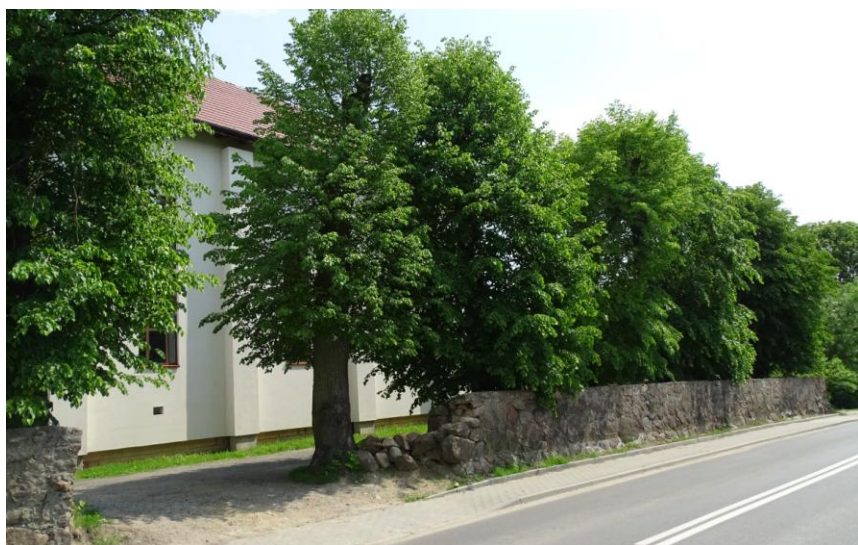
Widok ogólny od zachodu (z drogi)

8. Fotografia z opisem wskazującym orientację albo mapa z zaznaczonym stanowiskiem archeologicznym