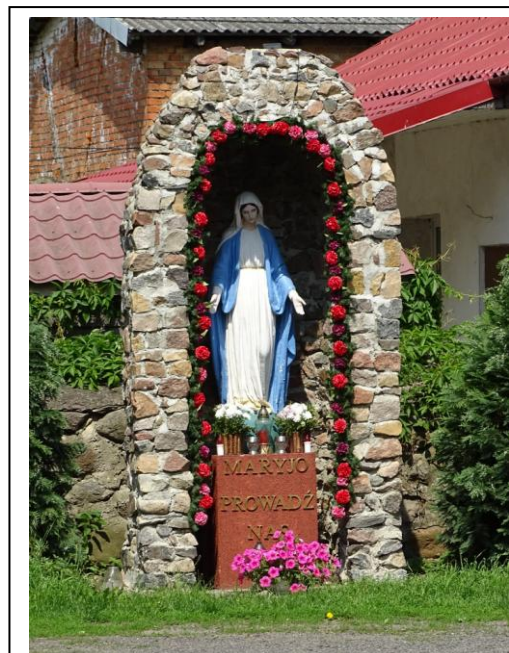
Kapliczka Matki Boskiej