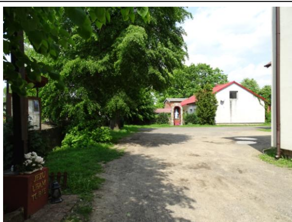
Zachodnia część cmentarza