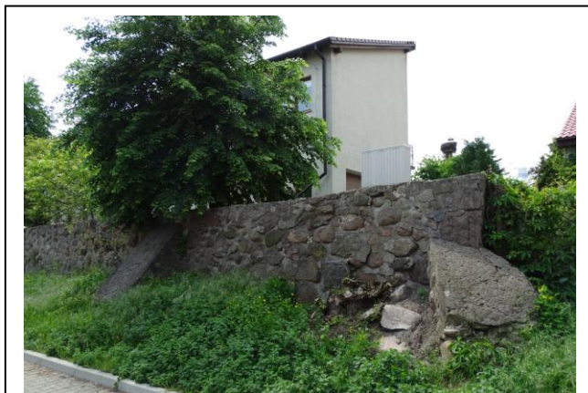
Widok od wschodu - ogrodzenie