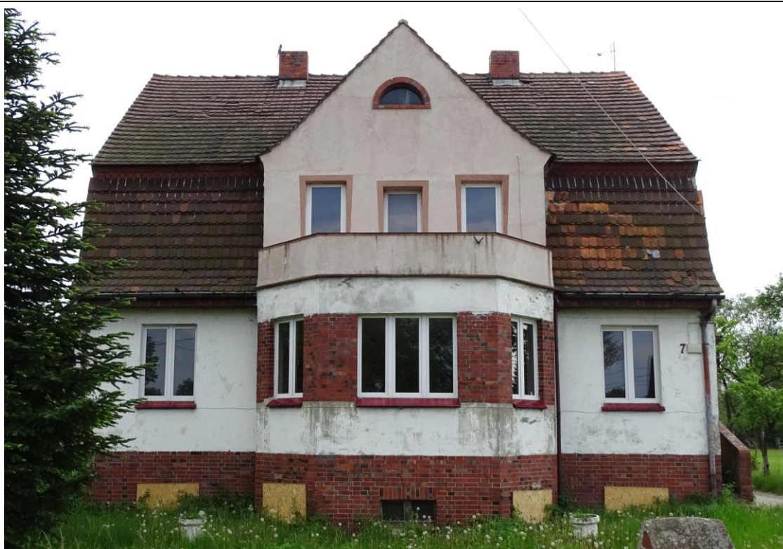
Elewacja frontowa - północna

8. Fotografia z opisem wskazującym orientację albo mapa z zaznaczonym stanowiskiem archeologicznym