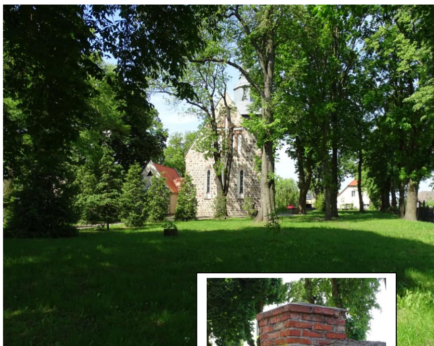
Widok ogólny od wschodu

8. Fotografia z opisem wskazującym orientację albo mapa z zaznaczonym stanowiskiem archeologicznym