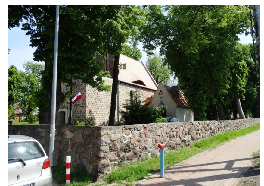
Widok ogólny od pld.-zachodu (mur ogrodzeniowy)

Cmentarz przykościelny założony został równocześnie z budową świątyni, zlikwidowany w XX w. Cmentarz założony na planie zbliżonym do wydłużonego prostokąta, wygodzony murem kamiennym, z wejściami od wschodu i zachodu – ob. zachowane ceglane filary bramne. Wzdłuż ogrodzenia (od wewnątrz) zawarte szpalery lip; na dwóch (uschniętych) lipach wyrzeźbiono kapliczki (JCH i MB). Na cmentarzu rosą również okazałe dęby, kasztanowce i jesiony. Brak widocznych śladów sepulkralnych.