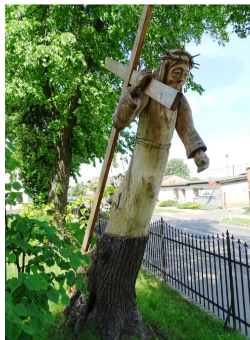
Starodrzew - kapliczka