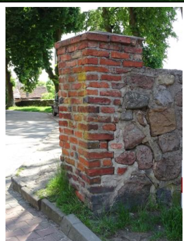
Filar bramny - zachodni