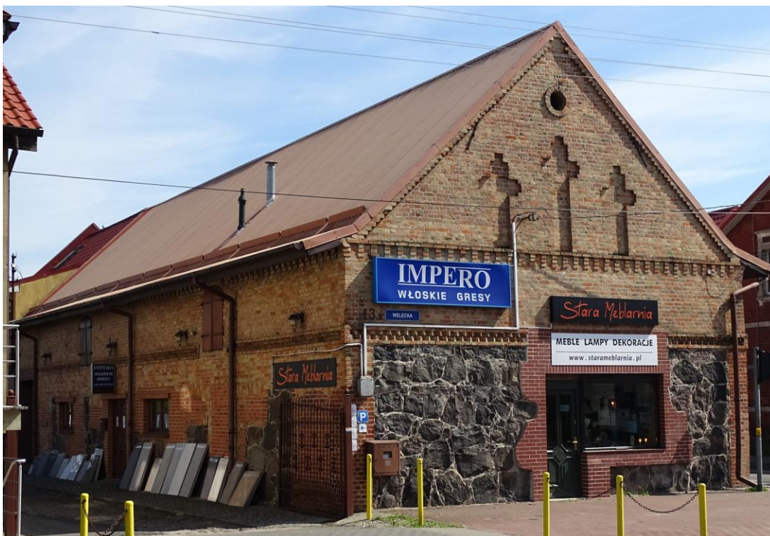
Widok ogólny od płd.-zachodu

8. Fotografia z opisem wskazującym orientację albo mapa z zaznaczonym stanowiskiem archeologicznym