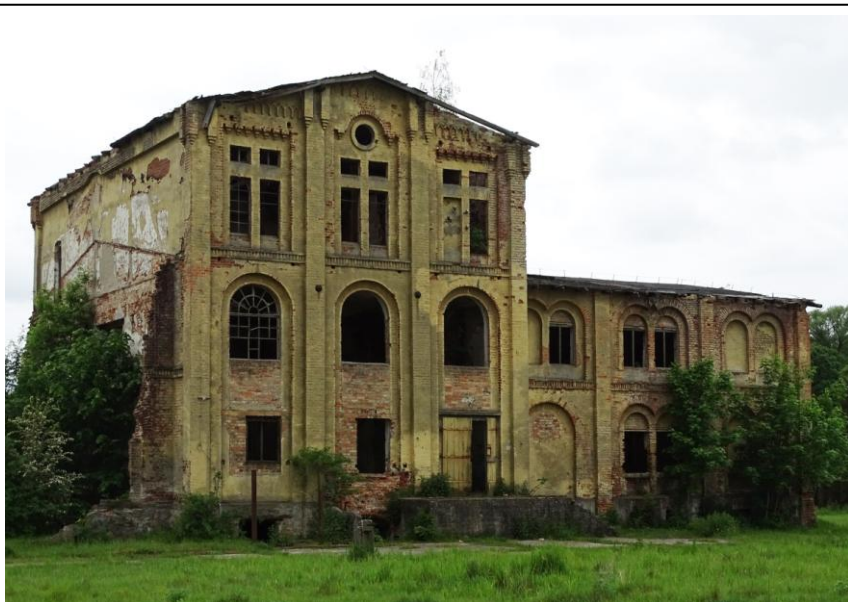
Widok ogólny od wschodu

8. Fotografia z opisem wskazującym orientację albo mapa z zaznaczonym stanowiskiem archeologicznym