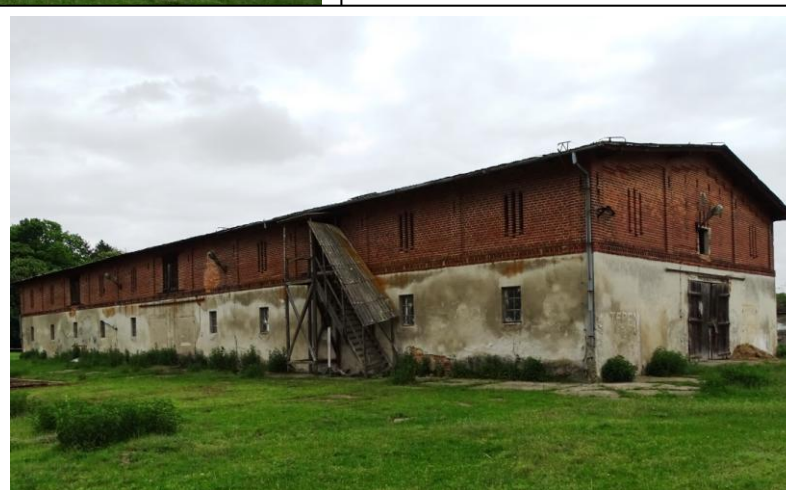
Widok ogólny od płd.-zachodu