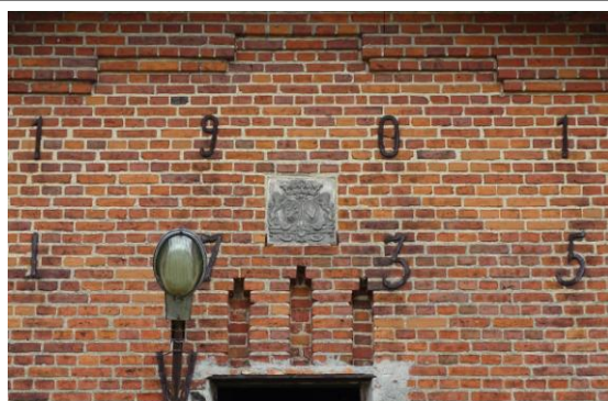
Datowniki w szczycie południowym