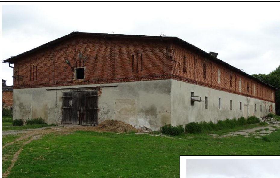
Widok ogólny od płd.-wschodu

8. Fotografia z opisem wskazującym orientację albo mapa z zaznaczonym stanowiskiem archeologicznym