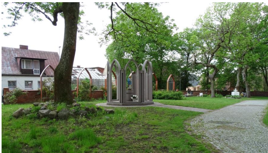
Cmentarz – część południowa

8. Fotografia z opisem wskazującym orientację albo mapa z zaznaczonym stanowiskiem archeologicznym