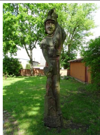
Kapliczka – św. Florian