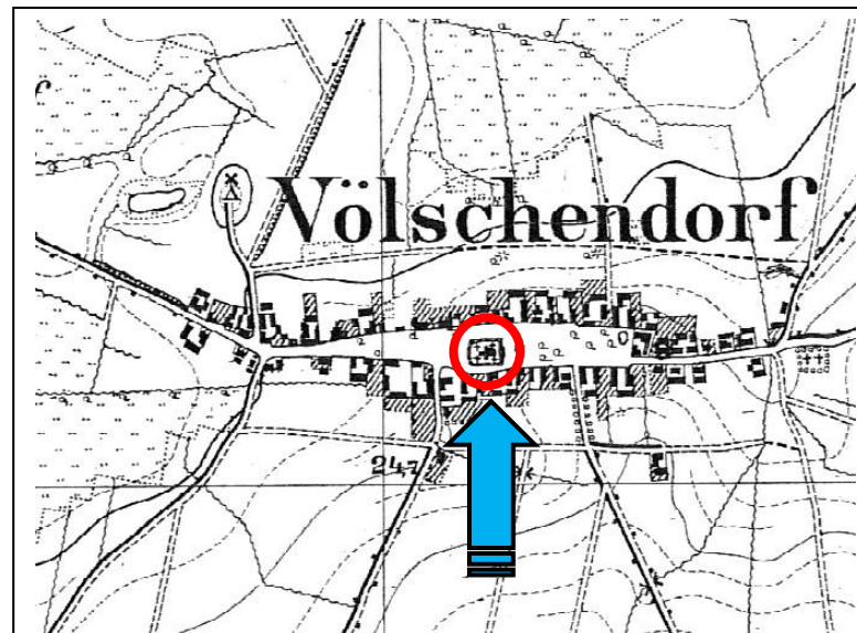
Wólczkowo: mapa sztabowa ( Messtischblatt ) - 1921