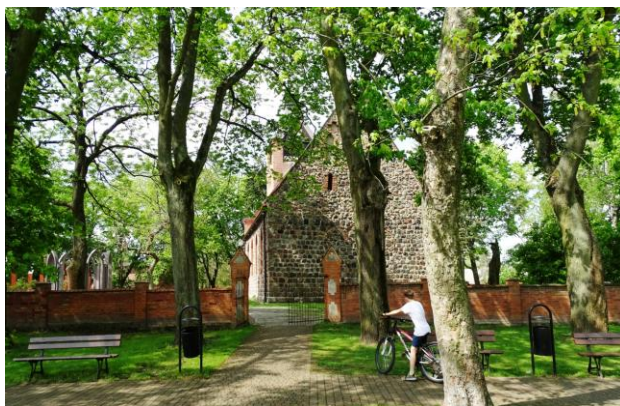
Widok ogólny od wschodu