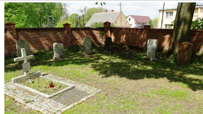
Lapidarium w ptn.-zachodniej części cmentarza