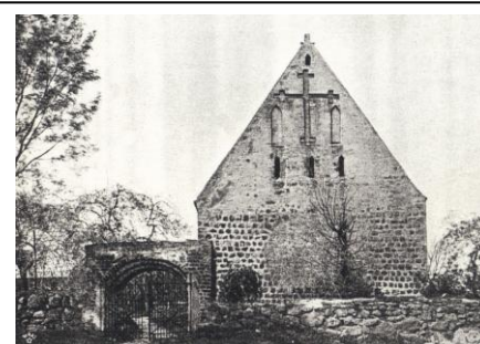
Kościół i cmentarz – ok. 1900 r.