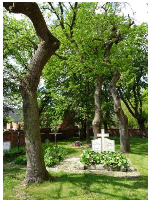
Kwaterna cmentarna w części pld.-zachodniej