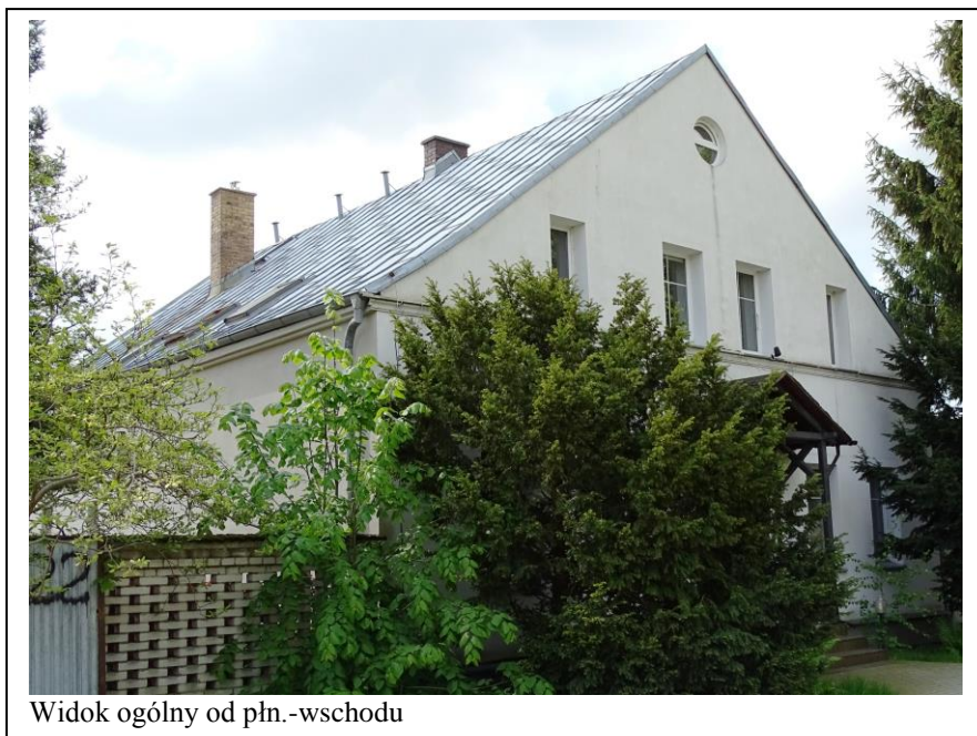
Widok ogólny od płn.-wschodu

Dawny dom mieszkalny – gospoda, o pierwotnej formie, ale wtórnym wystroju. Budynek wąskofrontowy, założony na planie prostokąta, parterowy, częściowo podpiwniczony, nakryty dachem dwuspadowym, z mieszkalnym poddaszem. Ściany murowane z cegły ceramicznej, tynkowane i docieplone. Fasada 5-osiowa, lustrzanie symetryczna, bezstylowa. Zachowane pierwotne drzwi: 2-skrzydłowe, płycinowe. Stolarka współczesna, częściowo odwzorowująca pierwotne formy.