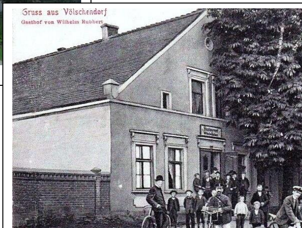
Dom nr 24 – 1910 r.