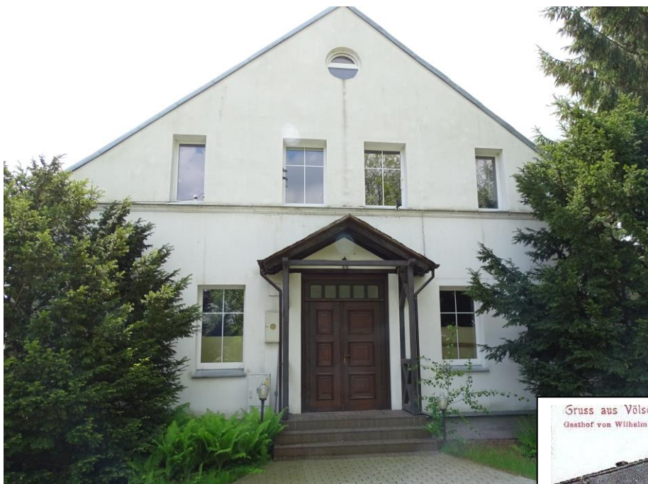
Elewacja frontowa - północna

8. Fotografia z opisem wskazującym orientację albo mapa z zaznaczonym stanowiskiem archeologicznym