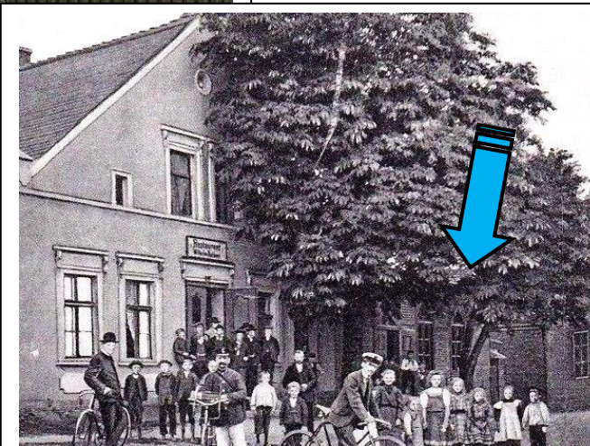
Gospoda nr 24 – 1910 r.