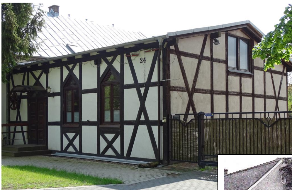
Elewacja frontowa - północna

8. Fotografia z opisem wskazującym orientację albo mapa z zaznaczonym stanowiskiem archeologicznym